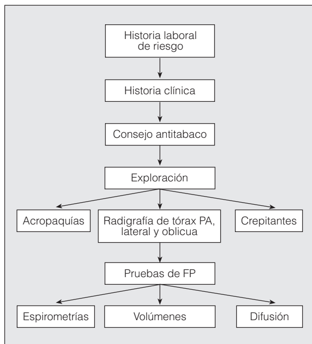
Fig. 3. Requisitos mínimos para el examen de salud periódico en trabajadores con exposición a asbesto. PA: posteroanterior; FP: función pulmonar.

Orden de 7 de diciembre de 2001, está prohibido todo nuevo uso o aplicación del amianto —nuestro país se adelantó a la normativa comunitaria, que lo prohíbe a partir del 1 de enero de 2005—, salvo en el sector de la demolición, para el que se reglamentan medidas de protección especiales, y para el sector de la fabricación de cloroálcalis (juntas de amianto en la fabricación de cloroálcalis). La prevención médica consiste sobre todo en la prevención con campañas antitabaco en todos los trabajadores que están o han estado expuestos.